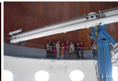
Hamburger Sternwarte in HH-Bergedorf