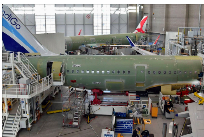
AIRBUS Werksführung, Hamburg Finkenwerder