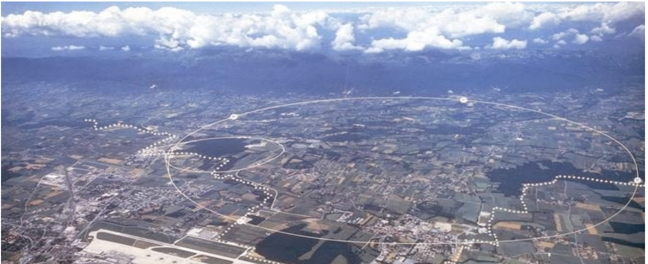
Der Ring des LHC (Large Hadron Colider), 27 Kilometer Umfang und in ca. 100 Meter Tiefe unterhalb der Erdoberfläche

Mit einführenden Sonder-Vortrag und verschiedenen Touren in und um Genf Besuch und Führung im CERN (Europäische Organisation für Kernforschung)