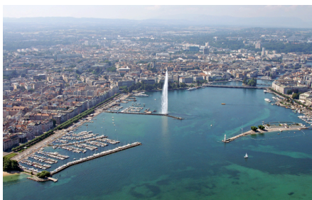
Genf und der große Genfer See