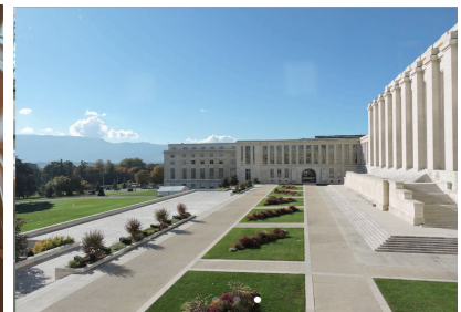
historisches Gebäude des UN-Office in Genf

WITTMANN TRAVEL e.K. Erlebnis • Kultur • Wissenschaft