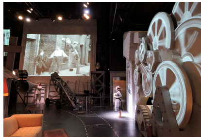
Ausschnitt aus dem Studio-Museum Chaplin's World